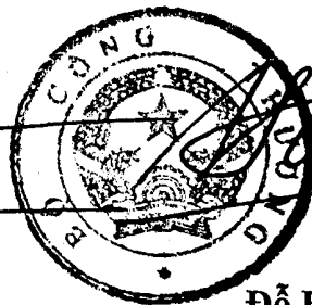
Đỗ Hữu Hào